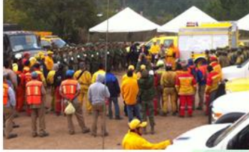
Unidad 4: Evaluación del Incidente/Evento y Guía Institucional para establecer los Objetivos del Incidente