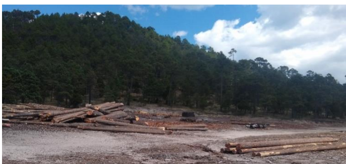
Fotografía 1. Largas dimensiones de madera en rollo de pino.

De manera general los precios de madera en rollo libre a bordo en brecha de clima templado presentaron incremento en relación al primer semestre de 2021. Las largas dimensiones de primario y secundario de la región sur presentan los precios más altos, mientras que las cortas dimensiones y la madera en pie muestran los precios más bajos.