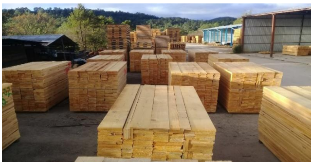
Fotografía 2. Patio de aserradero con madera aserrada de pino.

Los precios de la madera aserrada presentan incrementos significativos respecto a los precios obtenidos en el primer semestre 2021 (Ver grafica 2).