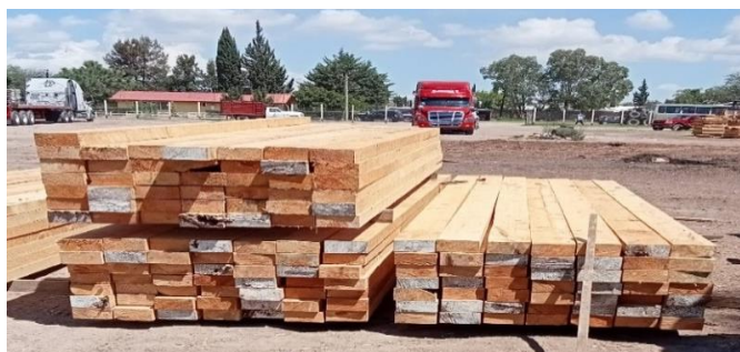
Fotografía 3. Madera aserrada de especies tropicales.

En lo que respecta a los precios de materias primas y productos forestales tropicales, la información se obtuvo en predios y aserraderos de los estados de Campeche, Tabasco, Quintana Roo y Veracruz, se consultaron precios de caoba y otras especies tropicales como, Tzalam, Chechen, Jabín, Chakté, Primavera, Zapote, Melina, Teca y Eucalipto